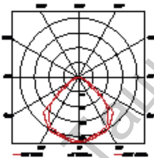
HS-S 150 W Slave